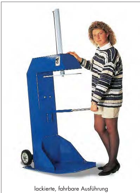
lackierte, fahrbare Ausführung