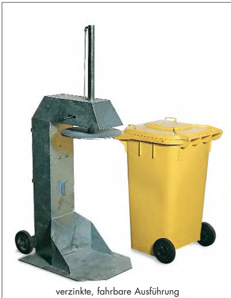
verzinkte, fahrbare Ausführung